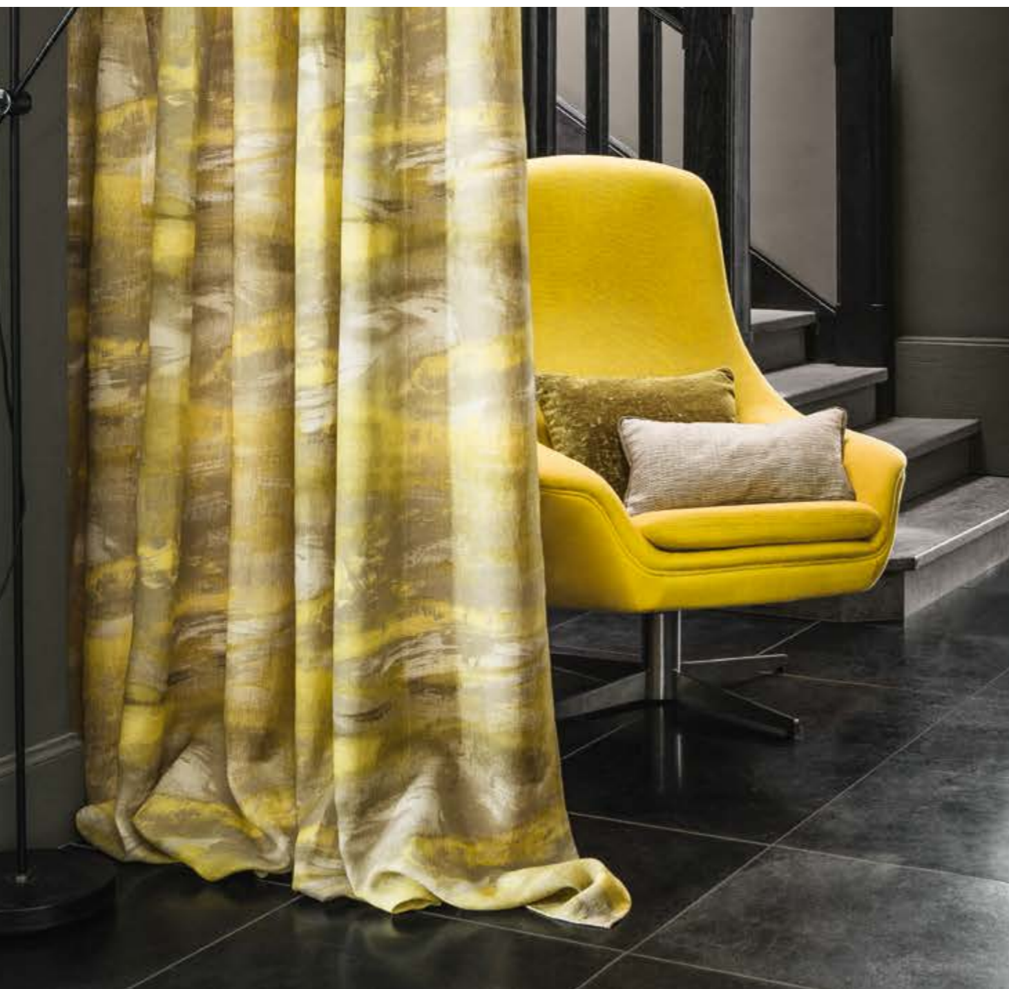
COLLECTION CHAUMONT Rideau / Curtain : CHOJI 3573 04 27