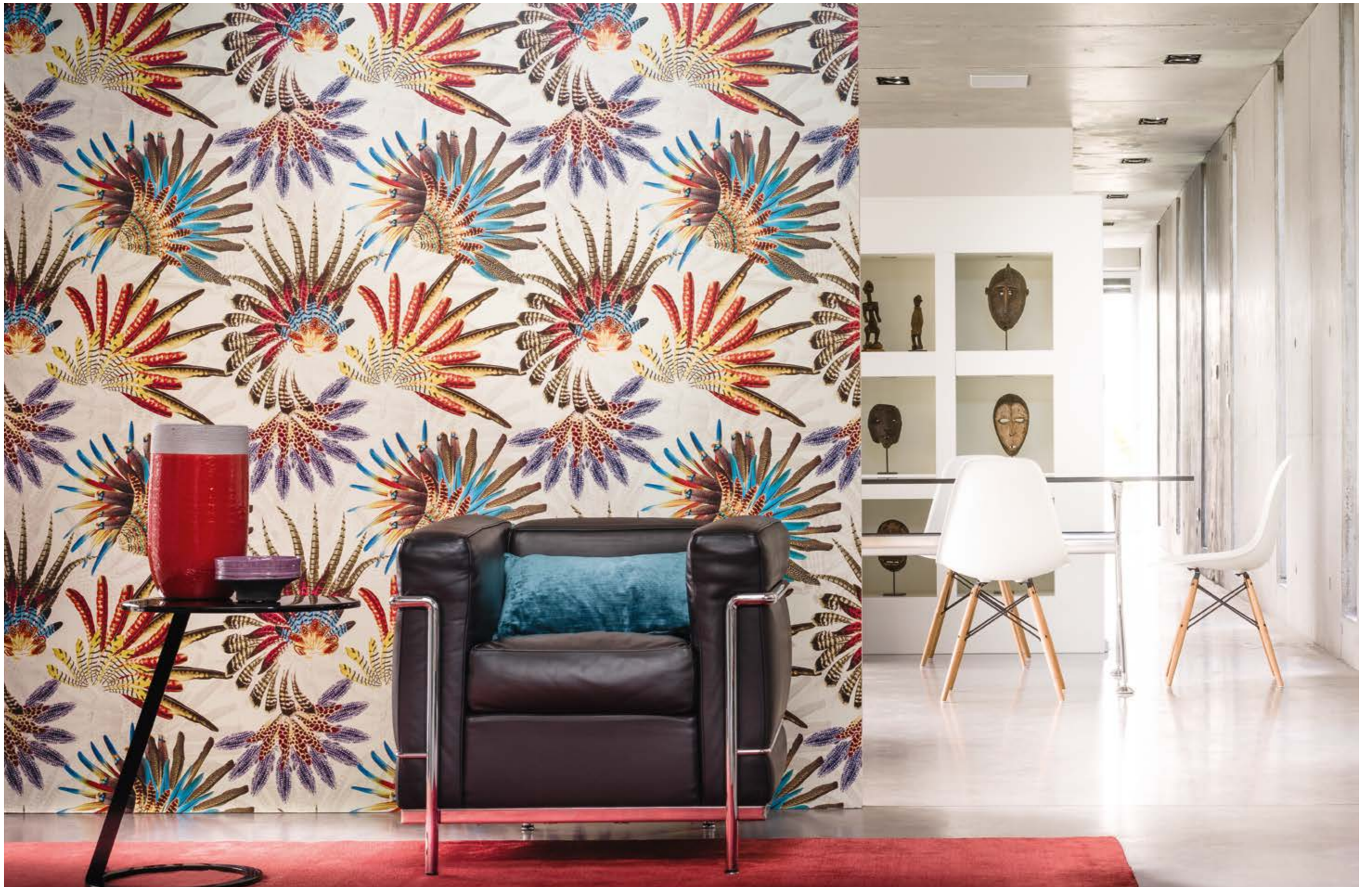
COLLECTION ACAJOU Rideau / Curtain : CHOJI 3573 04 27