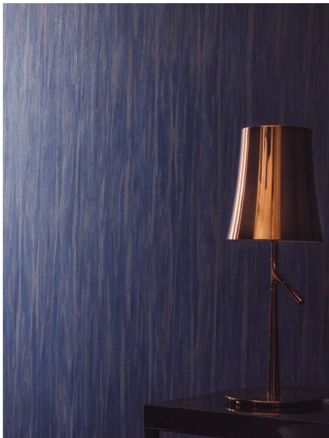
COLLECTION ACAJOU Rideau / Curtain : CHOJI 3573 04 27