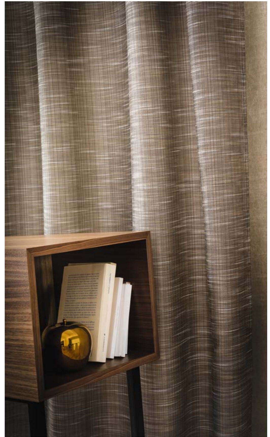
COLLECTION KRÉO Rideau / Curtain : CHOJI 3573 04 27