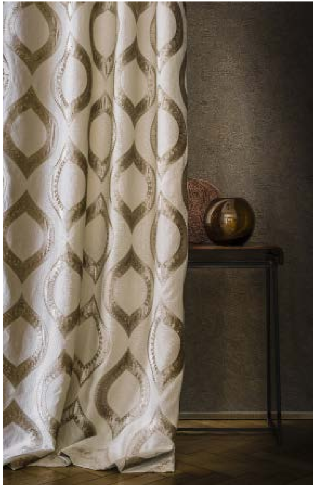
COLLECTION INÉDIT Rideau / Curtain : CHOJI 3573 04 27