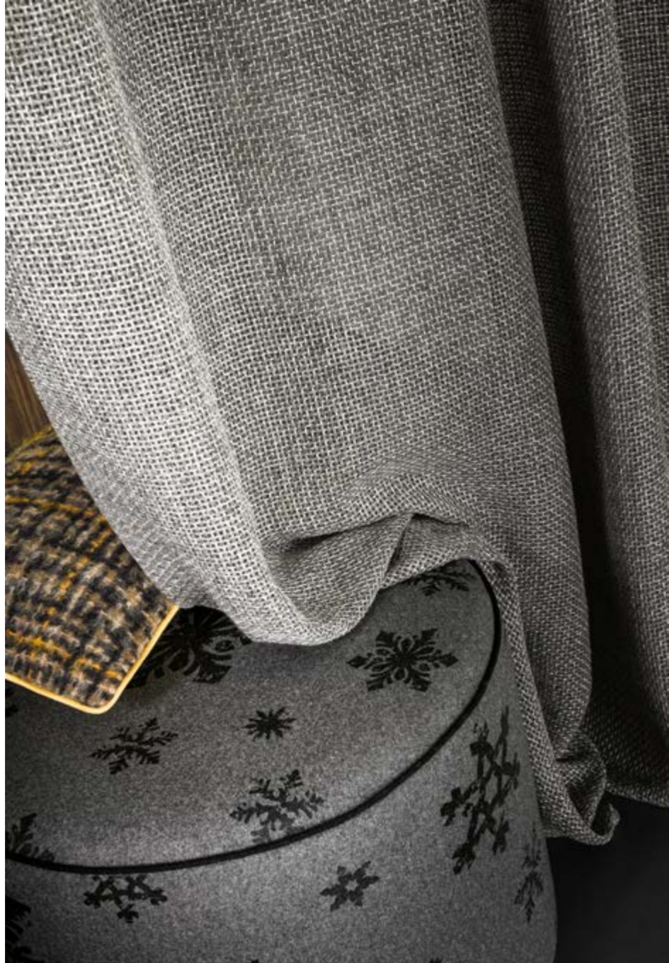
COLLECTION ALTA Rideau / Curtain : CHOJI 3573 04 27