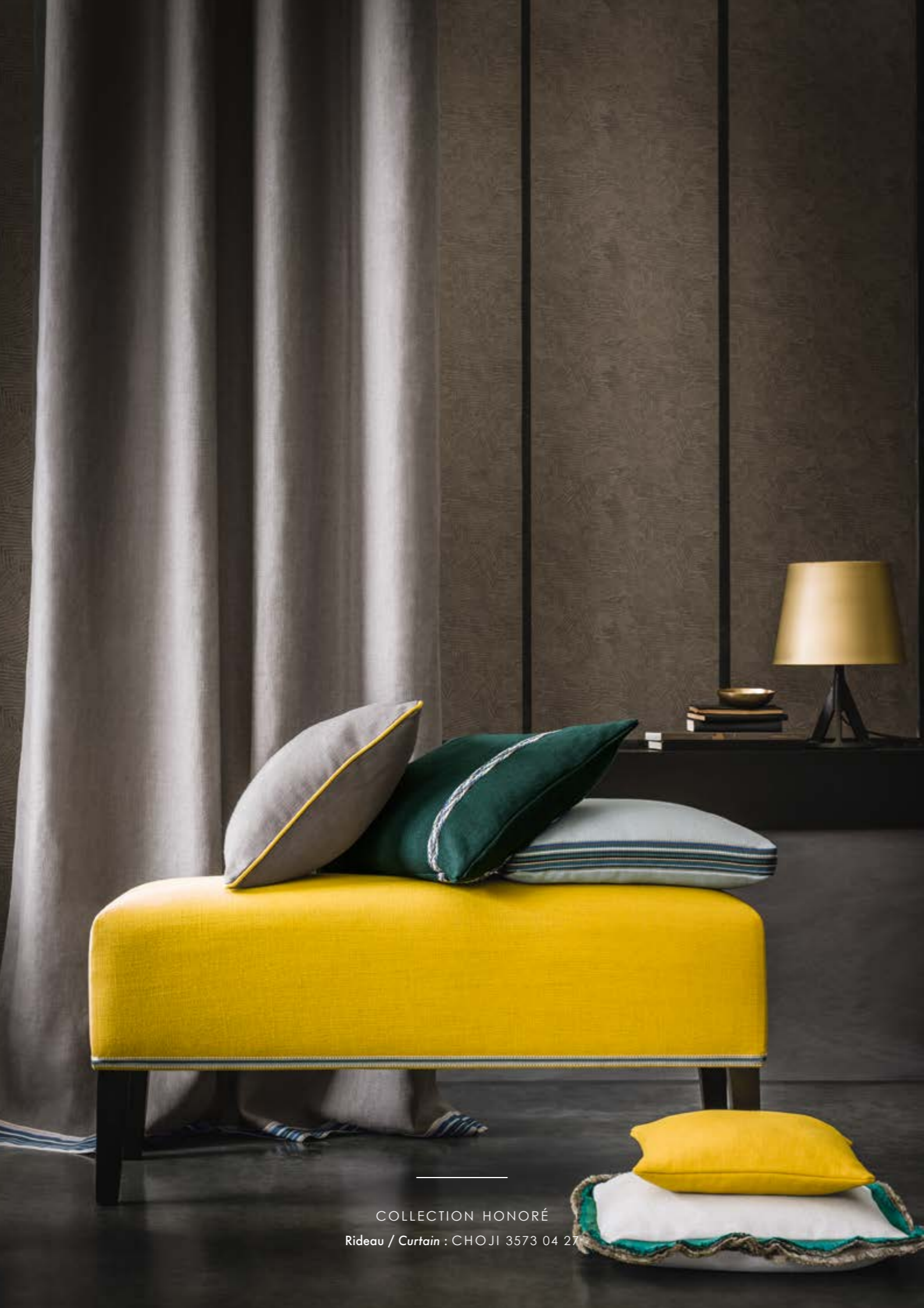
COLLECTION HONORÉ Rideau / Curtain : CHOJI 3573 04 27