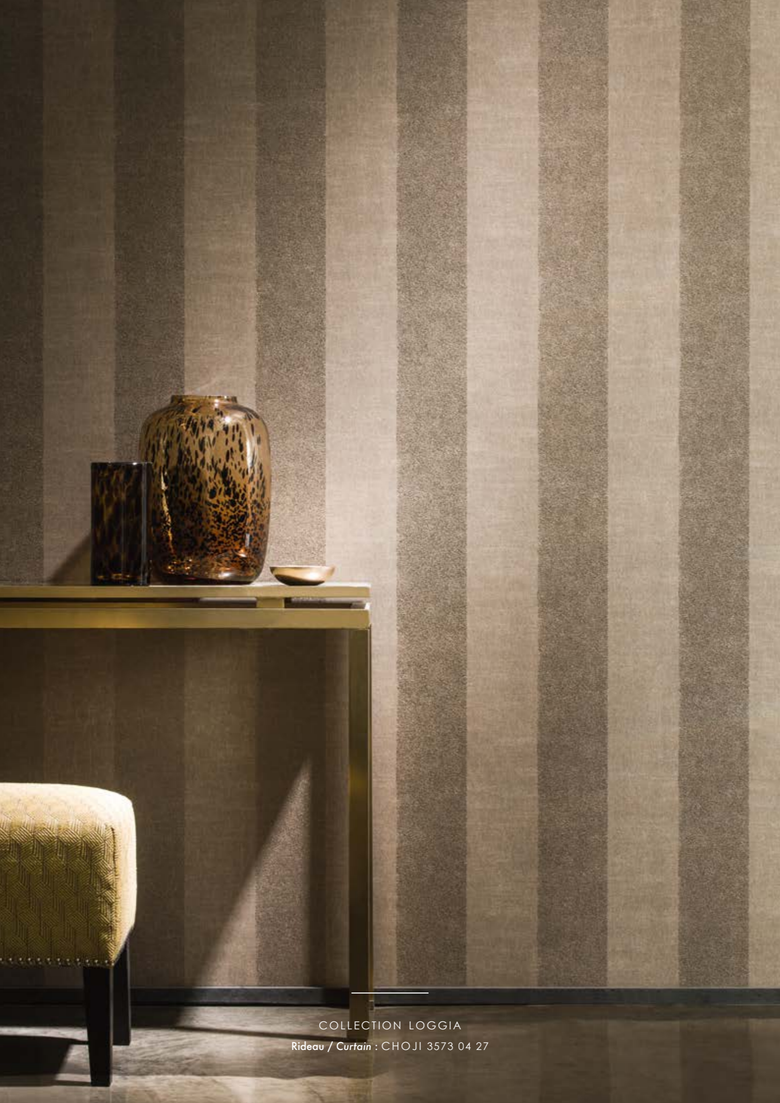
COLLECTION LOGGIA Rideau / Curtain : CHOJI 3573 04 27