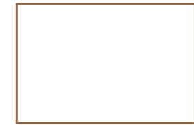
INÉDIT Imprimé plumes sur satin de coton Feather print on satin cotton