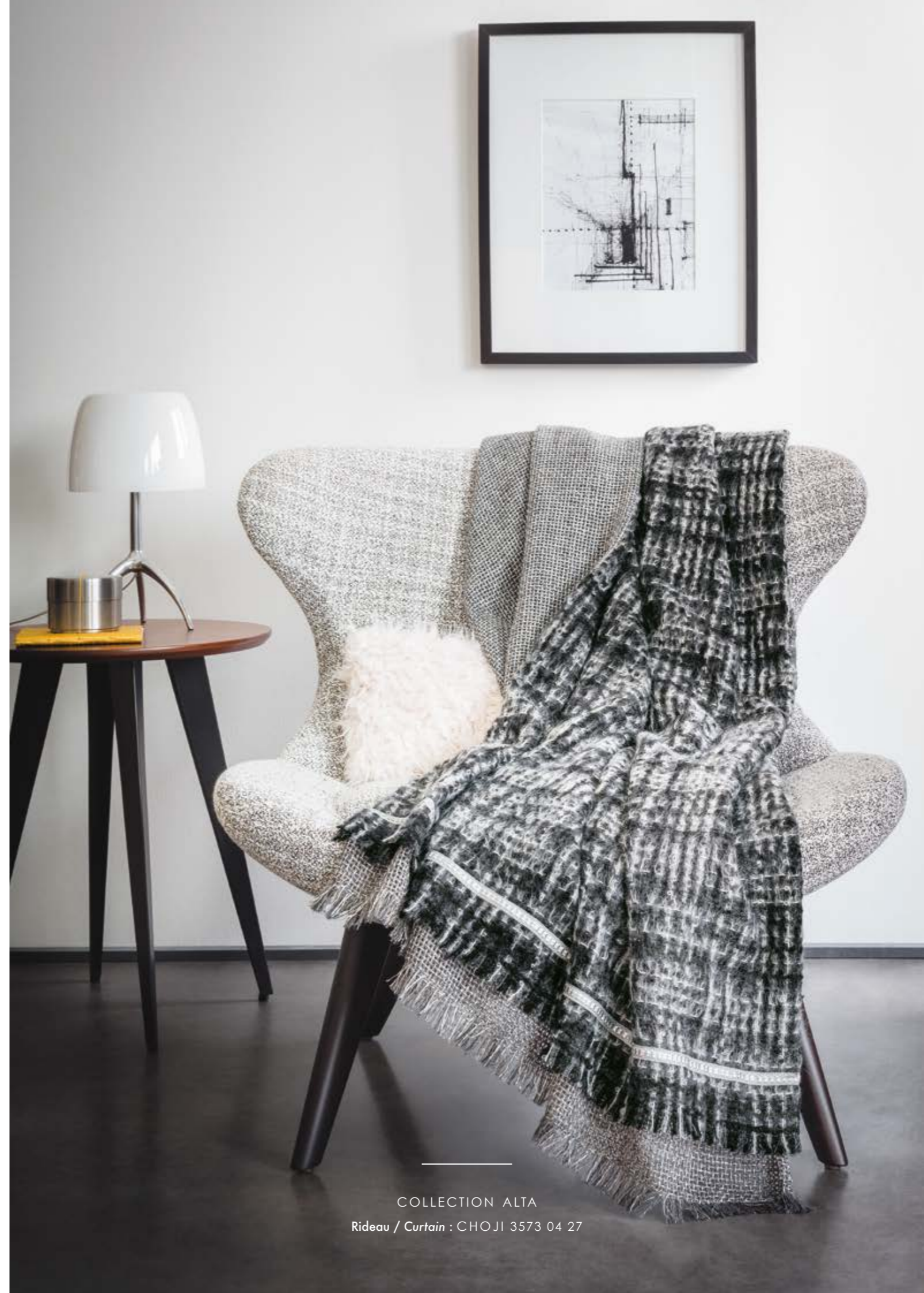
COLLECTION ALTA Rideau / Curtain : CHOJI 3573 04 27