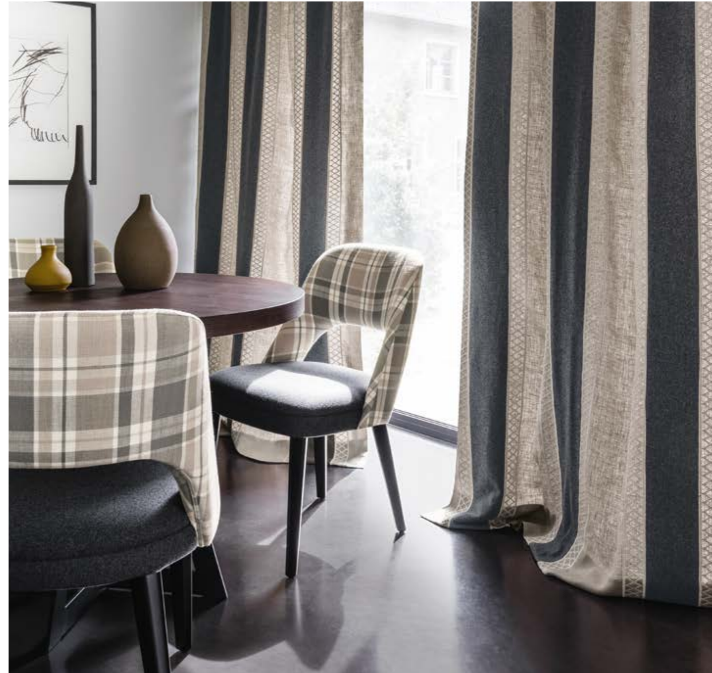
COLLECTION ALTA Rideau / Curtain : CHOJI 3573 04 27