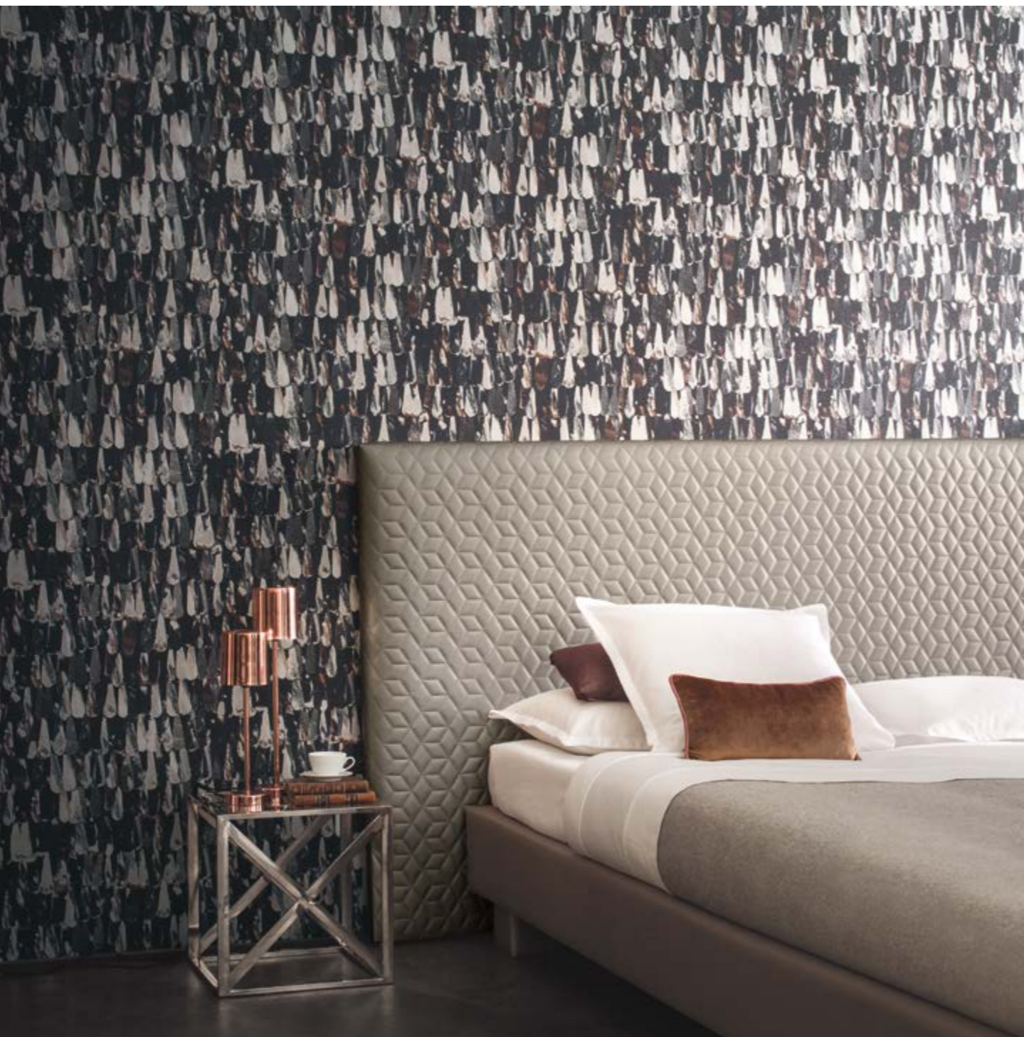
COLLECTION TITANE ET ACAJOU Rideau / Curtain : CHOJI 3573 04 27