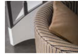
TITANE Satins unis et jacquards Plain satins and jacquards