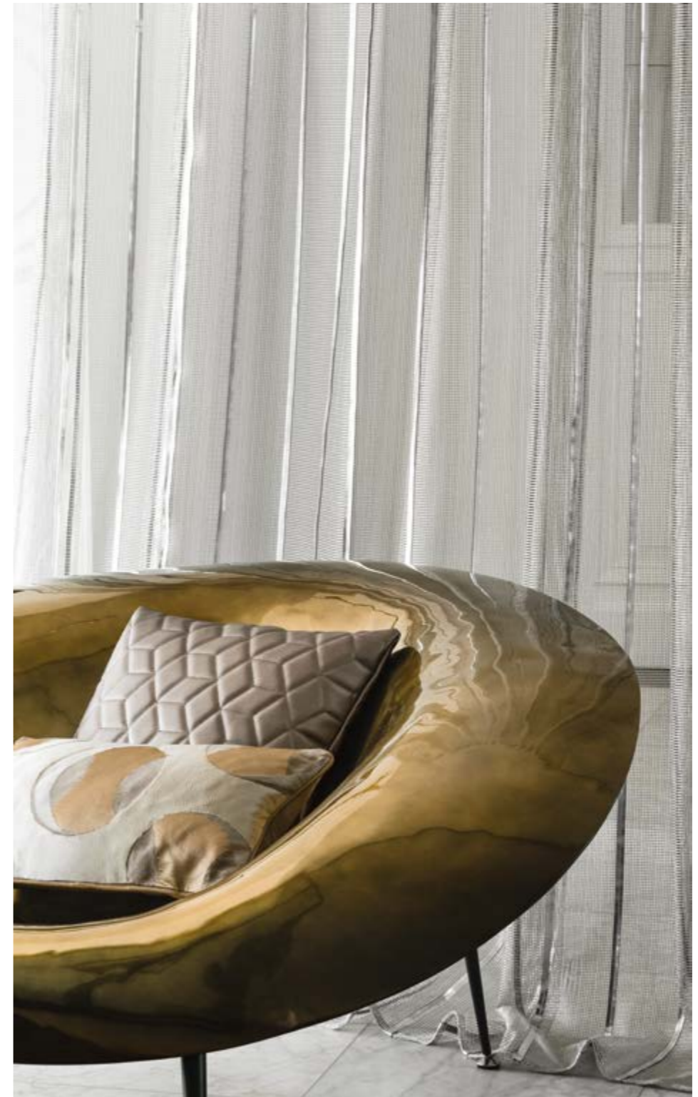
COLLECTION KRÉO Rideau / Curtain : CHOJI 3573 04 27