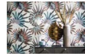
ACAJOU Effets végétaux sur intissé Vegetal effects on non woven