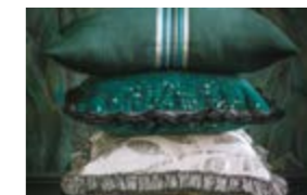
ISPAHAN & ISLINGTON Passementerie soyeuse et inspiration cuir Silky trimmings and leather effects