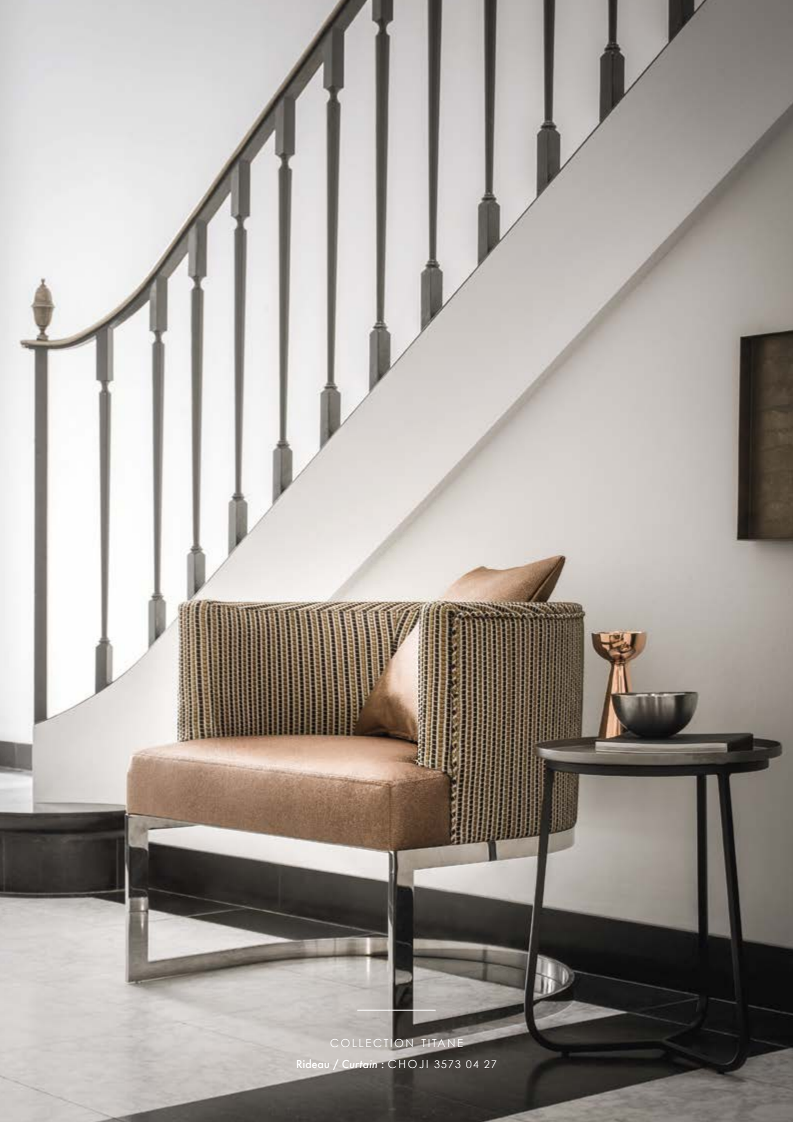
COLLECTION TITANE Rideau / Curtain : CHOJI 3573 04 27