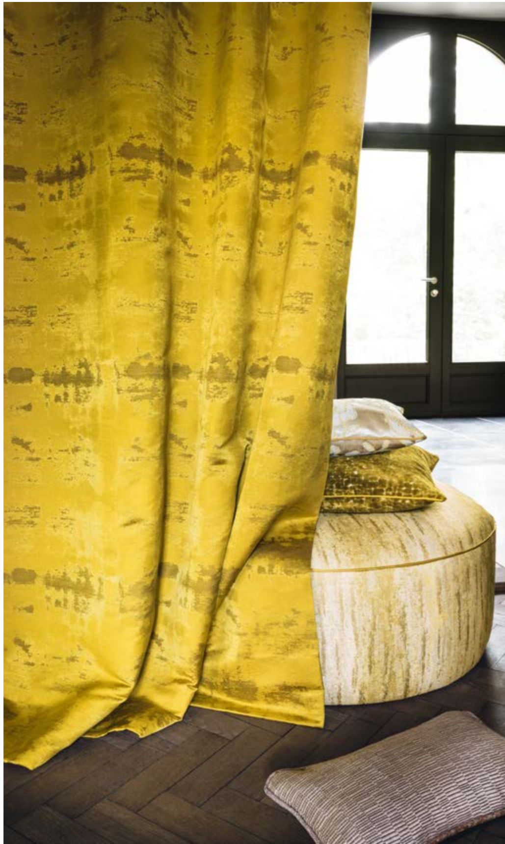
COLLECTION CHAUMONT Rideau / Curtain : CHOJI 3573 04 27