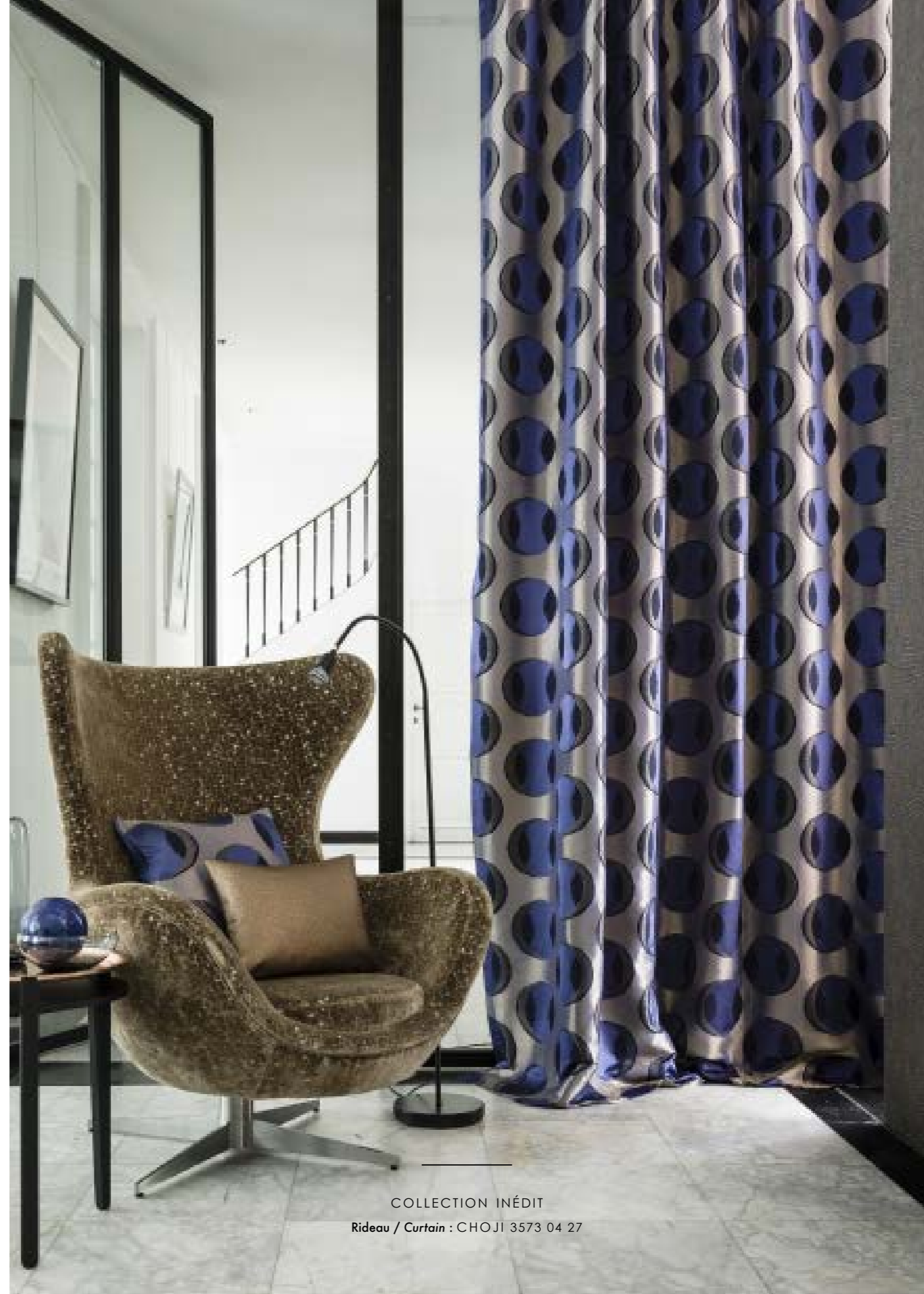
COLLECTION INÉDIT Rideau / Curtain : CHOJI 3573 04 27