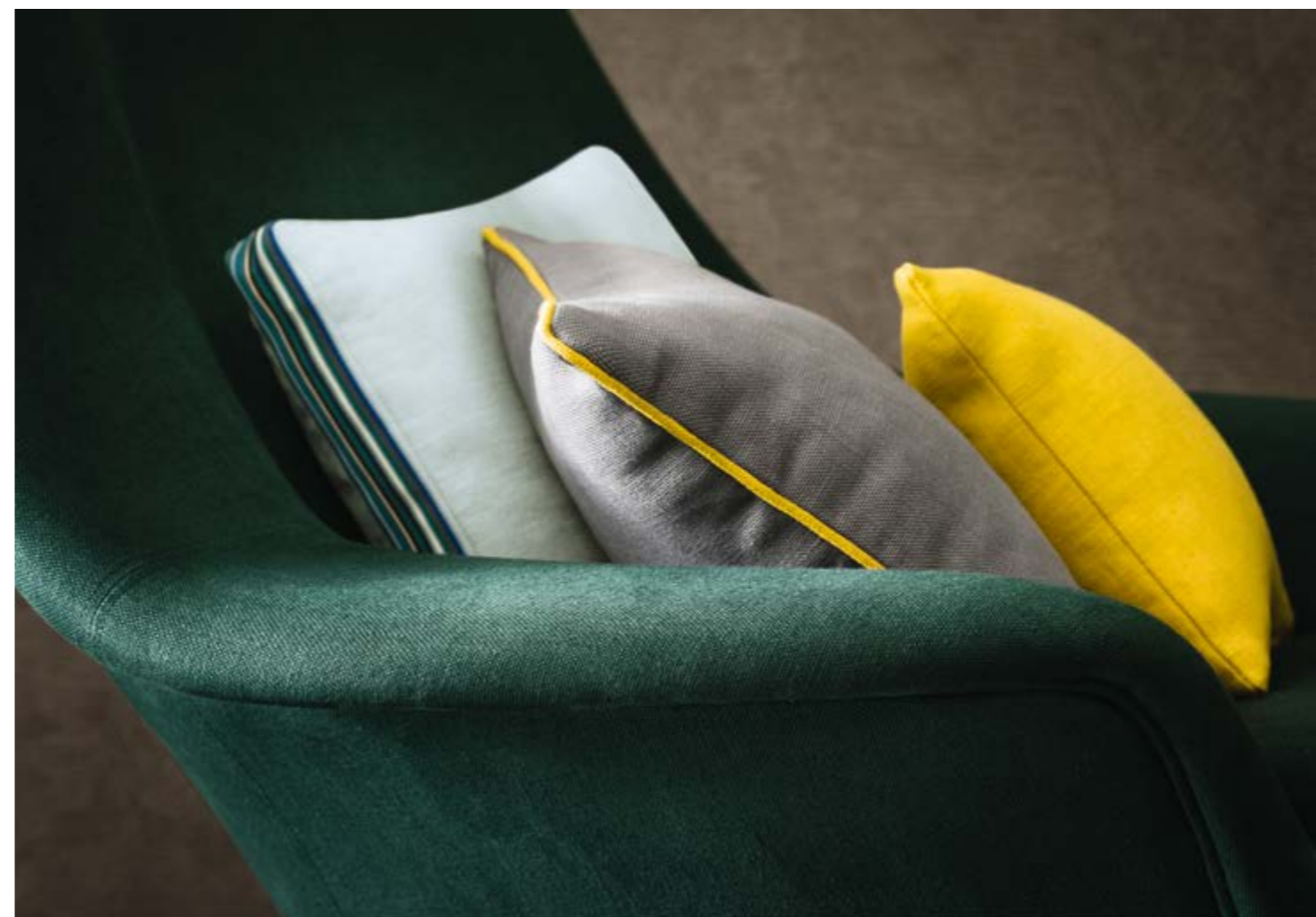
COLLECTION HONORÉ Rideau / Curtain : CHOJI 3573 04 27