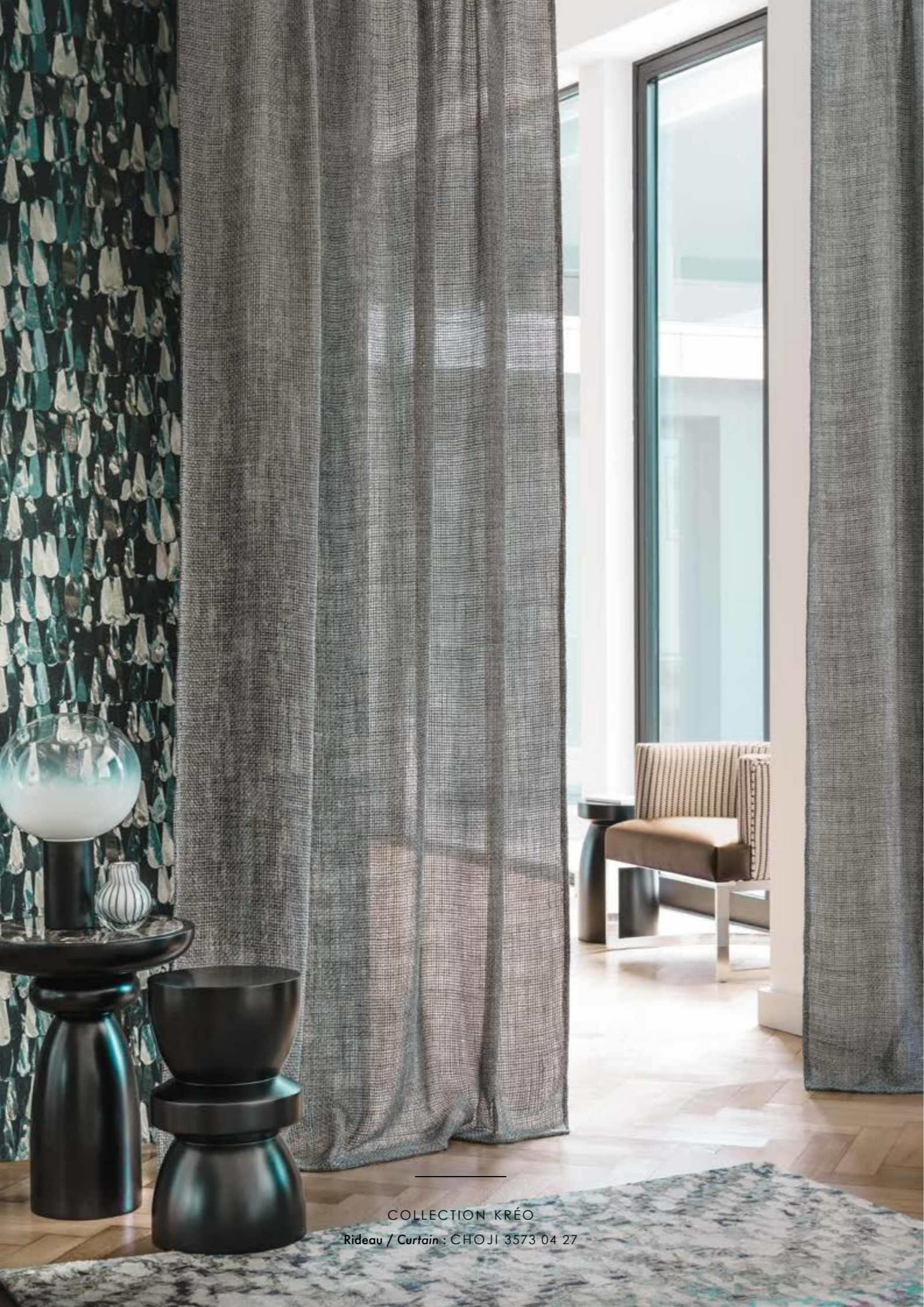
COLLECTION KRÉO Rideau / Curtain : CHOJI 3573 04 27