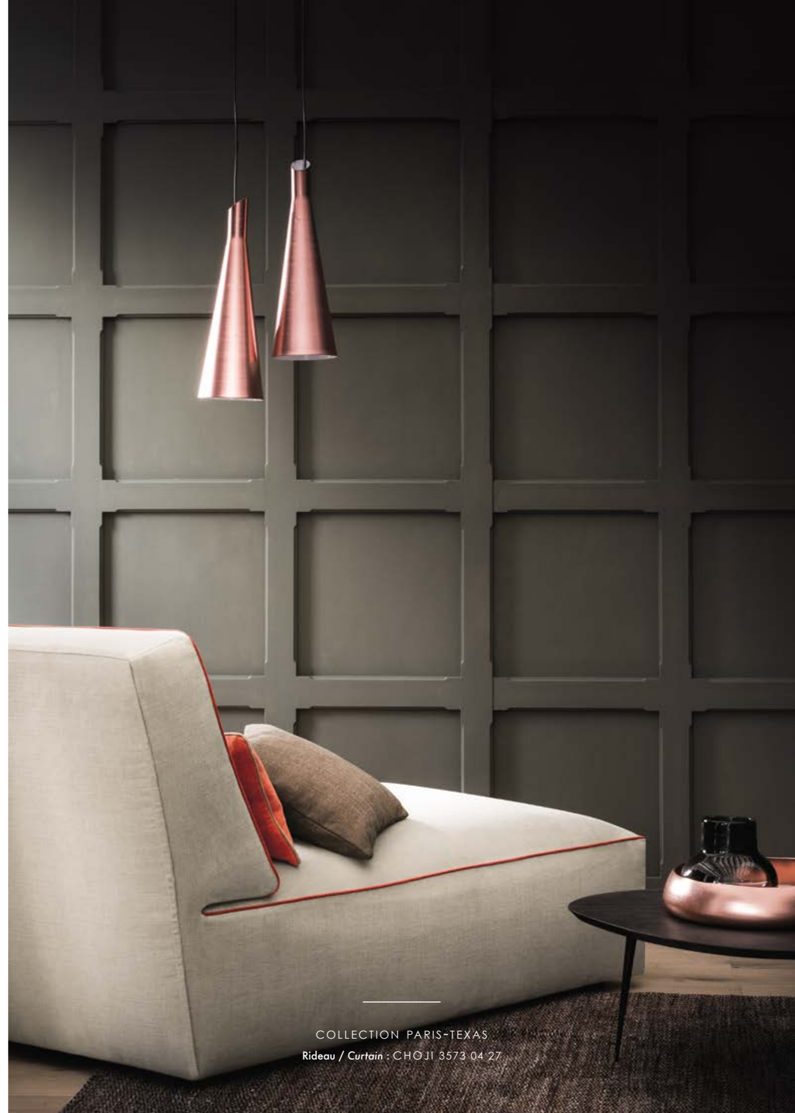
COLLECTION PARIS-TEXAS Rideau / Curtain : CHOJI 3573 04 27