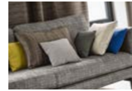
TRIODE Majesté des fleurs brodées Majesty of embroidered flowers