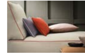
PARIS-TEXAS Etoffes satinées étincelantes Gleaming satin fabrics