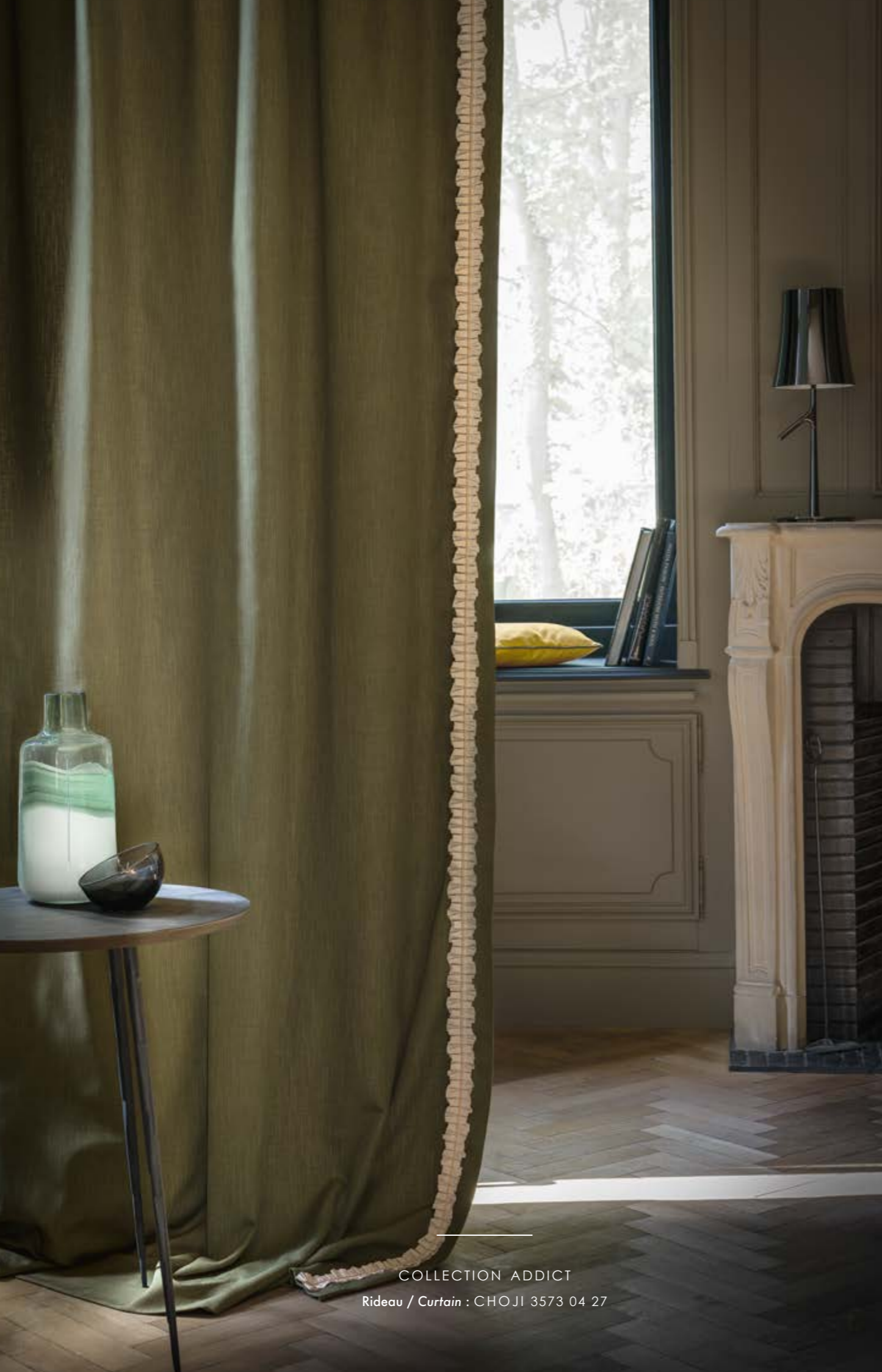
COLLECTION ADDICT Rideau / Curtain : CHOJI 3573 04 27