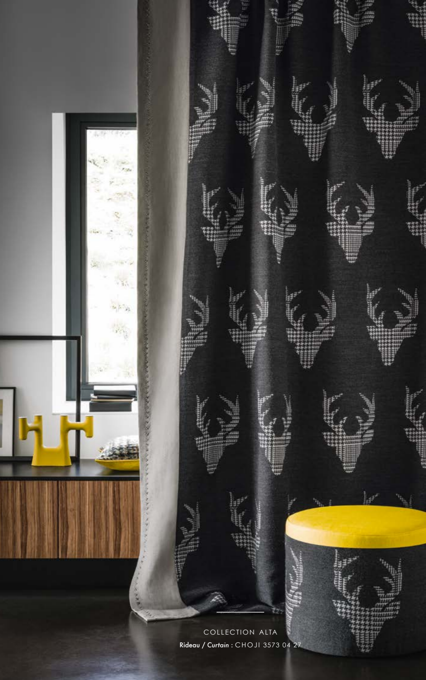
COLLECTION ALTA Rideau / Curtain : CHOJI 3573 04 27