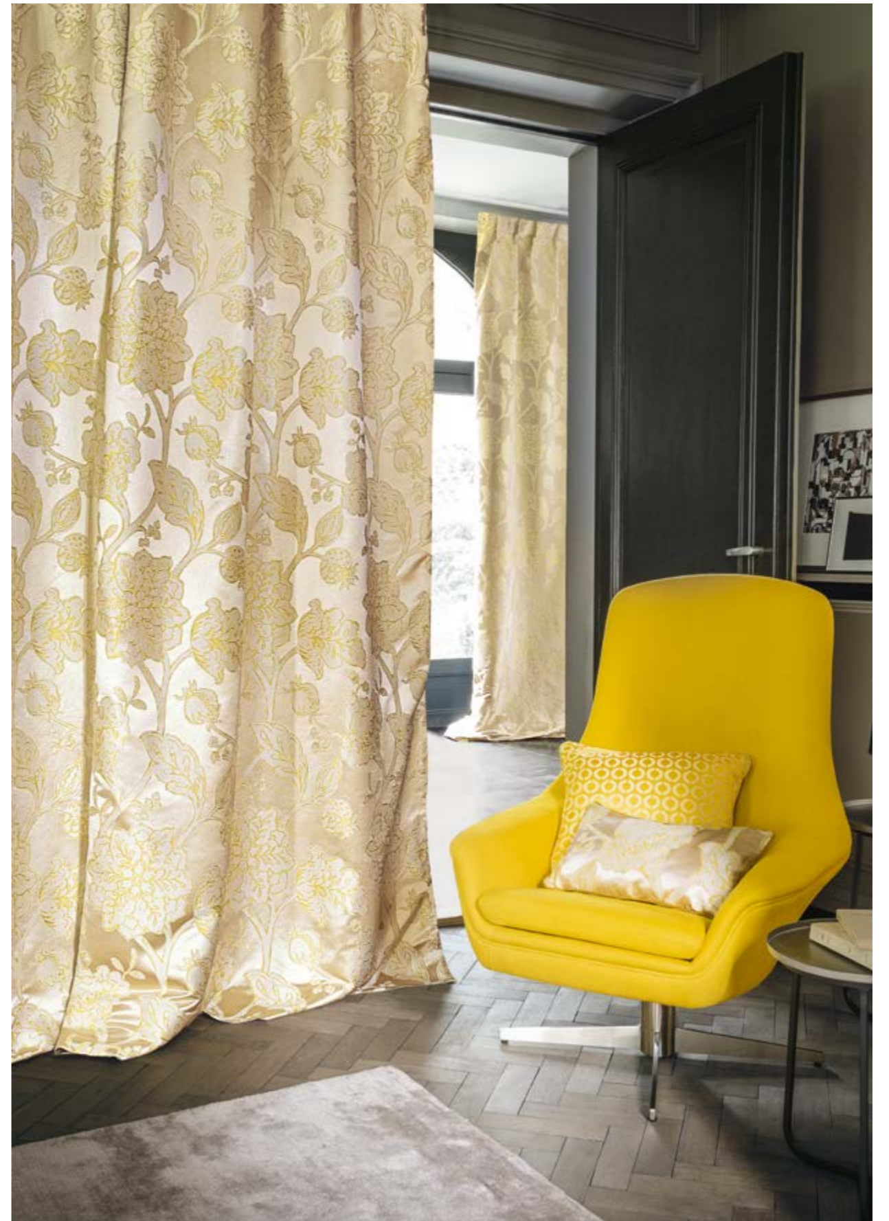
COLLECTION CHAUMONT Rideau / Curtain : CHOJI 3573 04 27