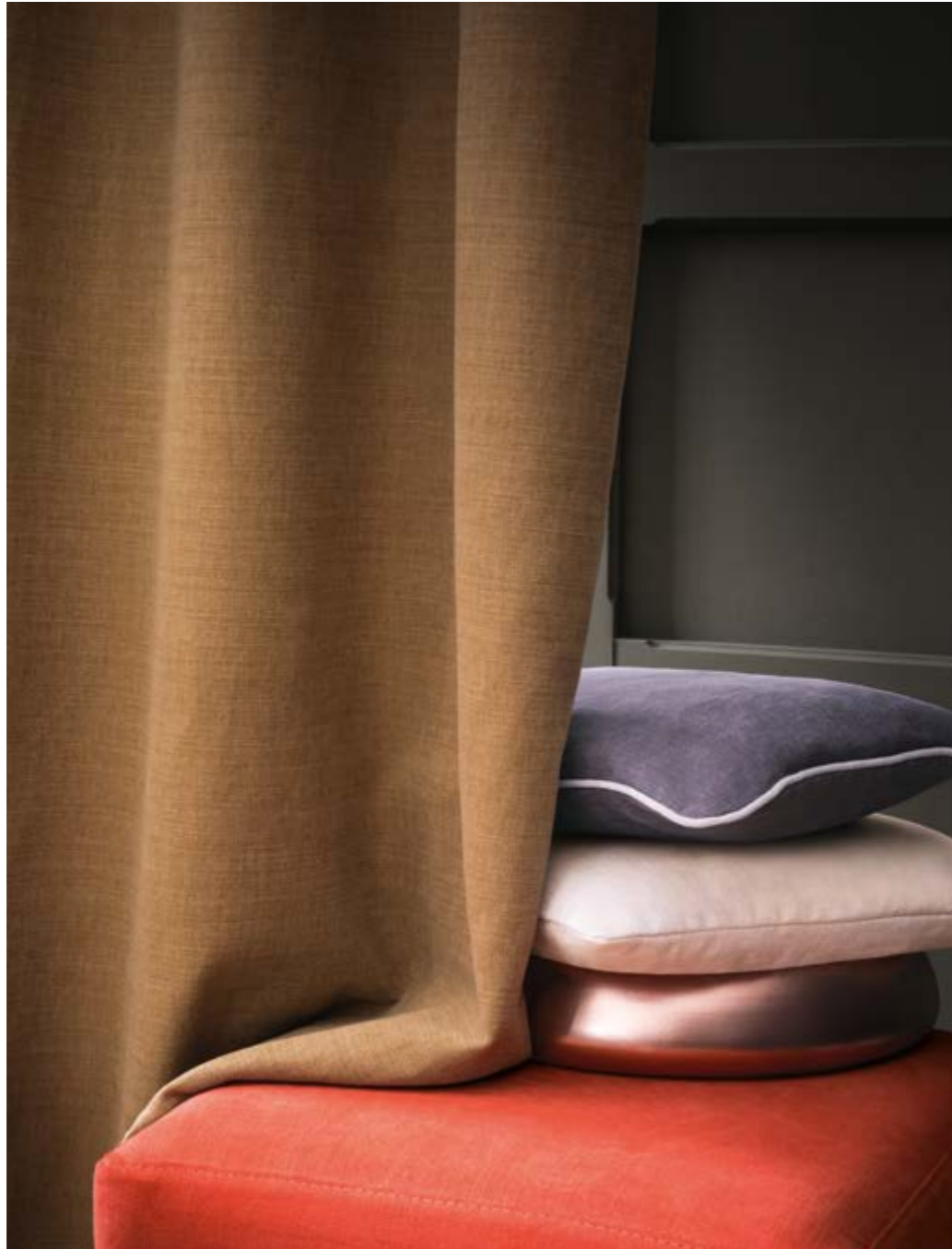
COLLECTION PARIS-TEXAS Rideau / Curtain : CHOJI 3573 04 27