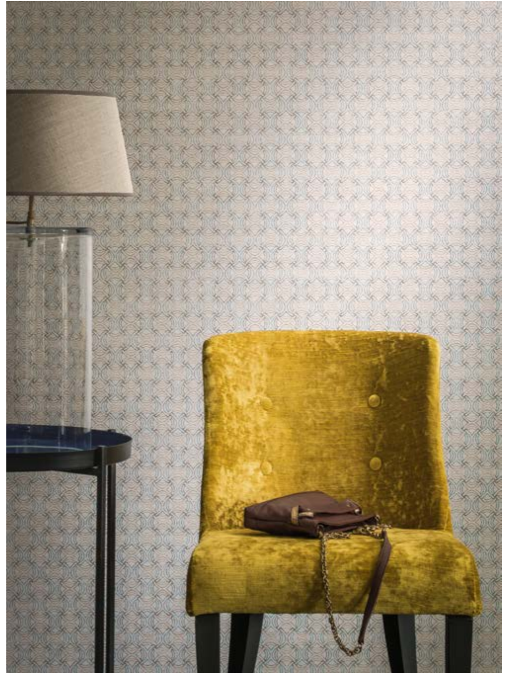
COLLECTION LOGGIA Rideau / Curtain : CHOJI 3573 04 27