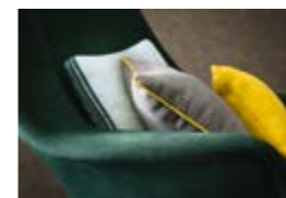
HONORÉ Natté flammé lin coton Plaited flamed linen cotton