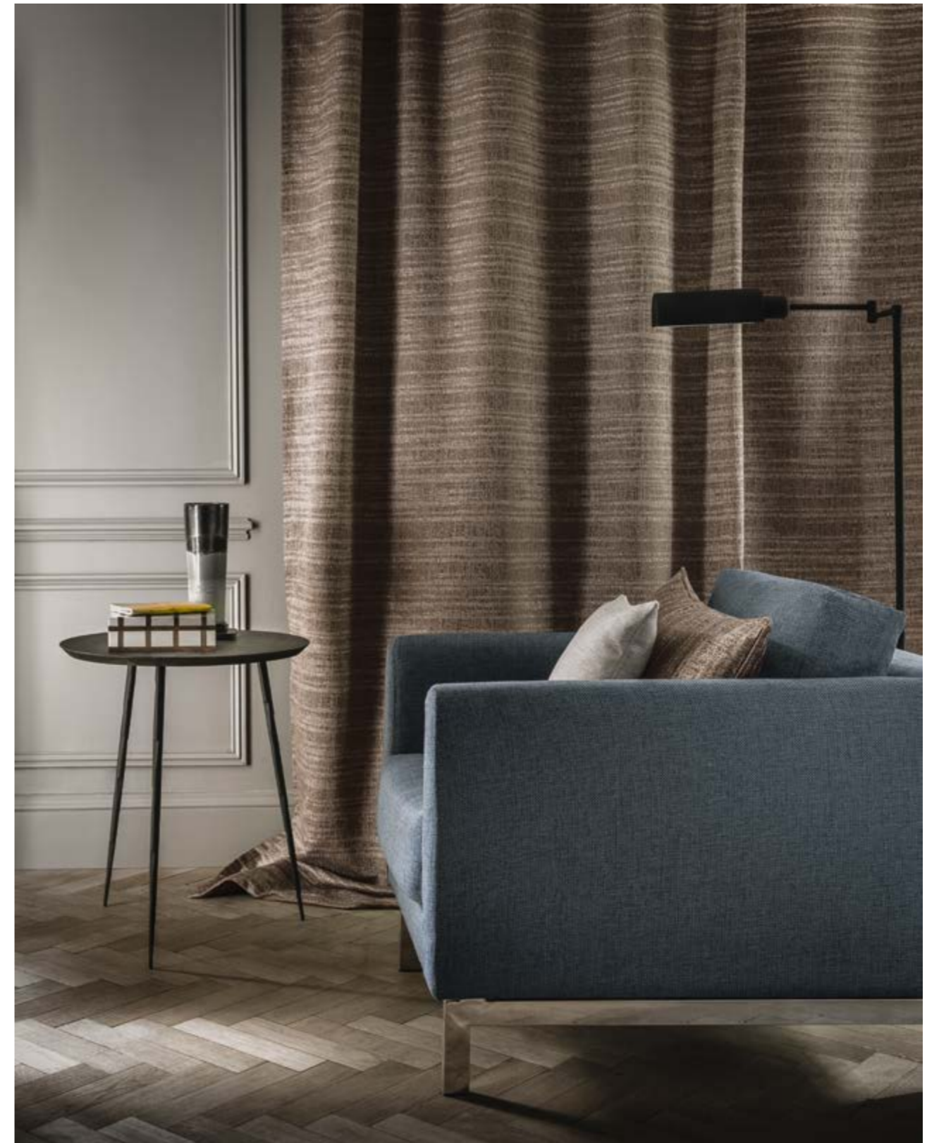
COLLECTION TRIODE Rideau / Curtain : CHOJI 3573 04 27