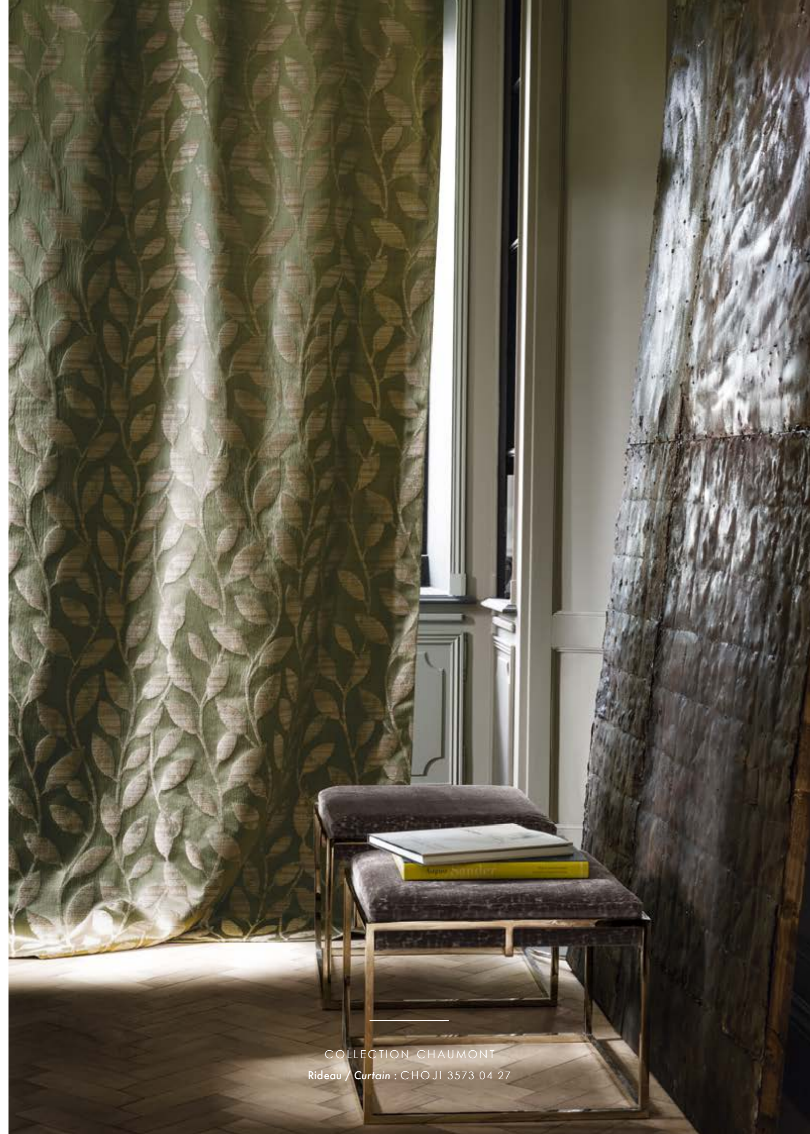
COLLECTION CHAUMONT Rideau / Curtain : CHOJI 3573 04 27