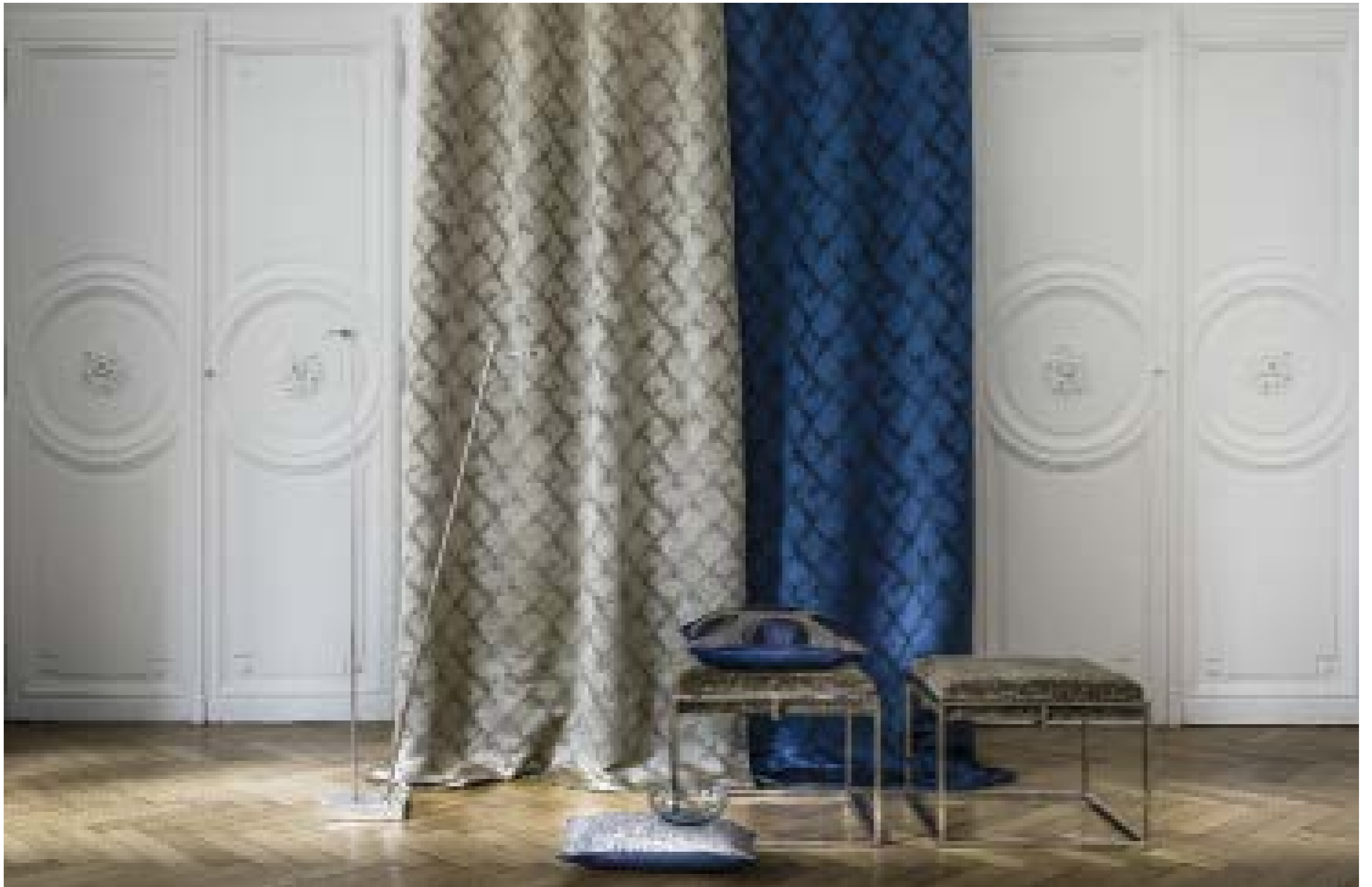
COLLECTION INÉDIT Rideau / Curtain : CHOJI 3573 04 27