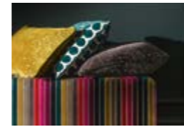
OPUS Collection végétale Botanical collection