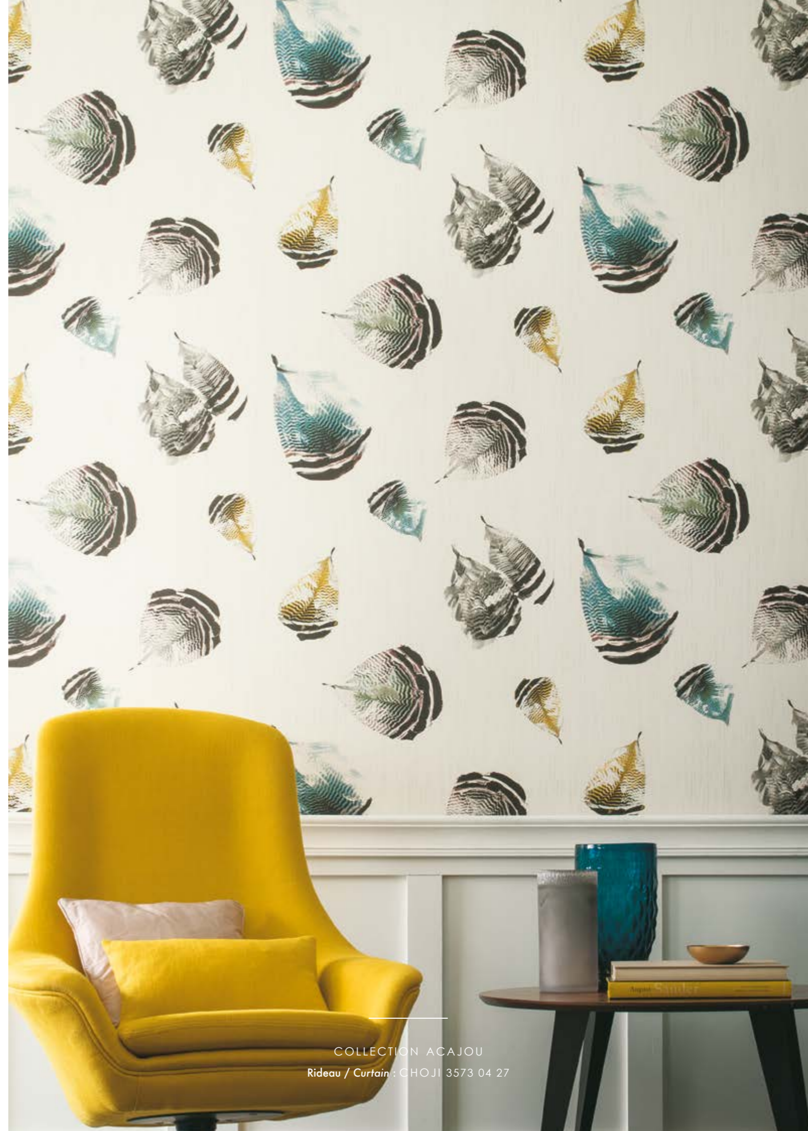
COLLECTION ACAJOU Rideau / Curtain : CHOJI 3573 04 27