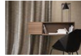
KRÉO Etoffes satinées étincelantes Gleaming satin fabrics