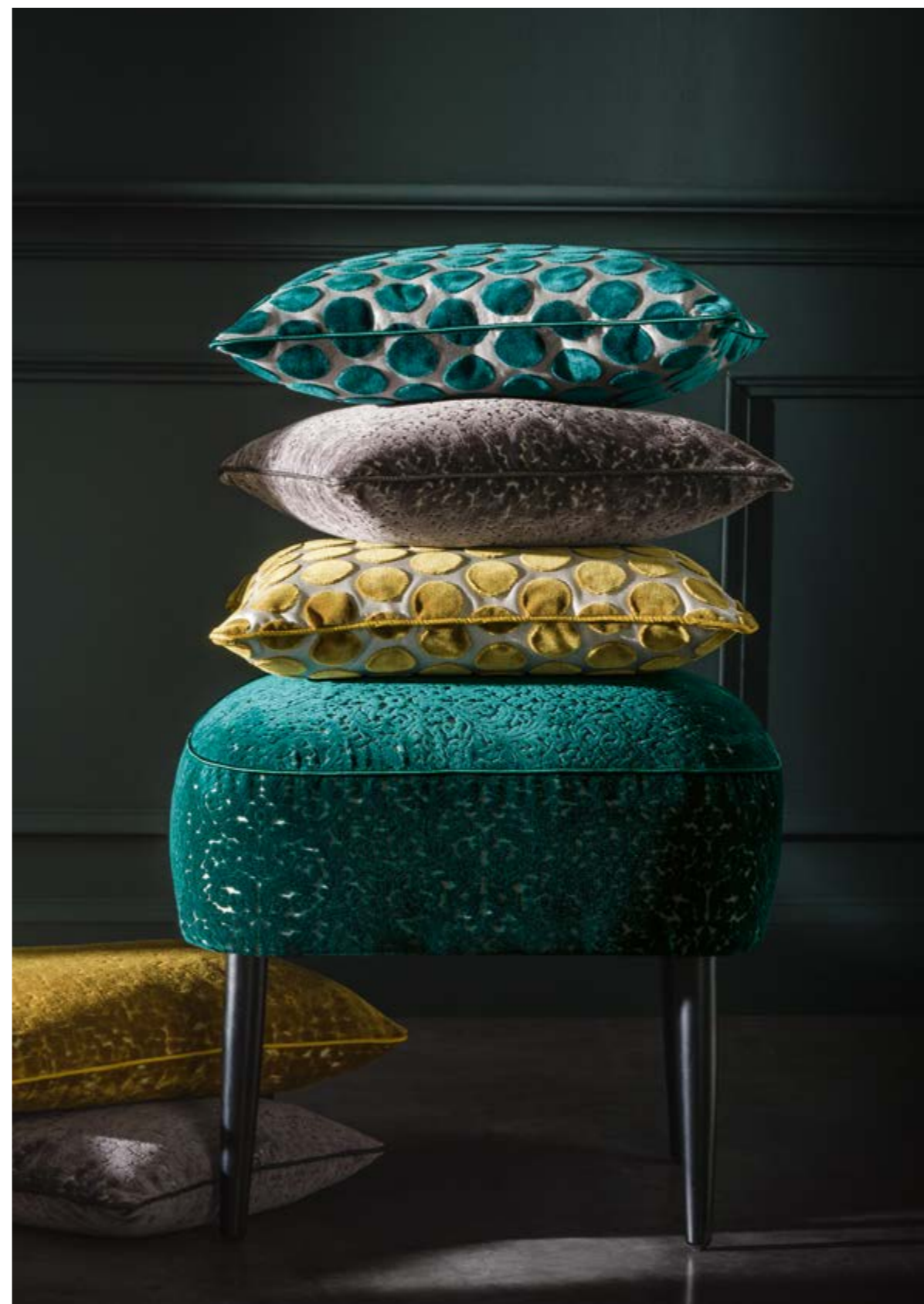
COLLECTION OPUS Rideau / Curtain : CHOJI 3573 04 27