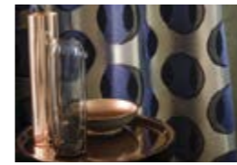
INÉDIT Imprimé plumes sur satin de coton Feather print on satin cotton