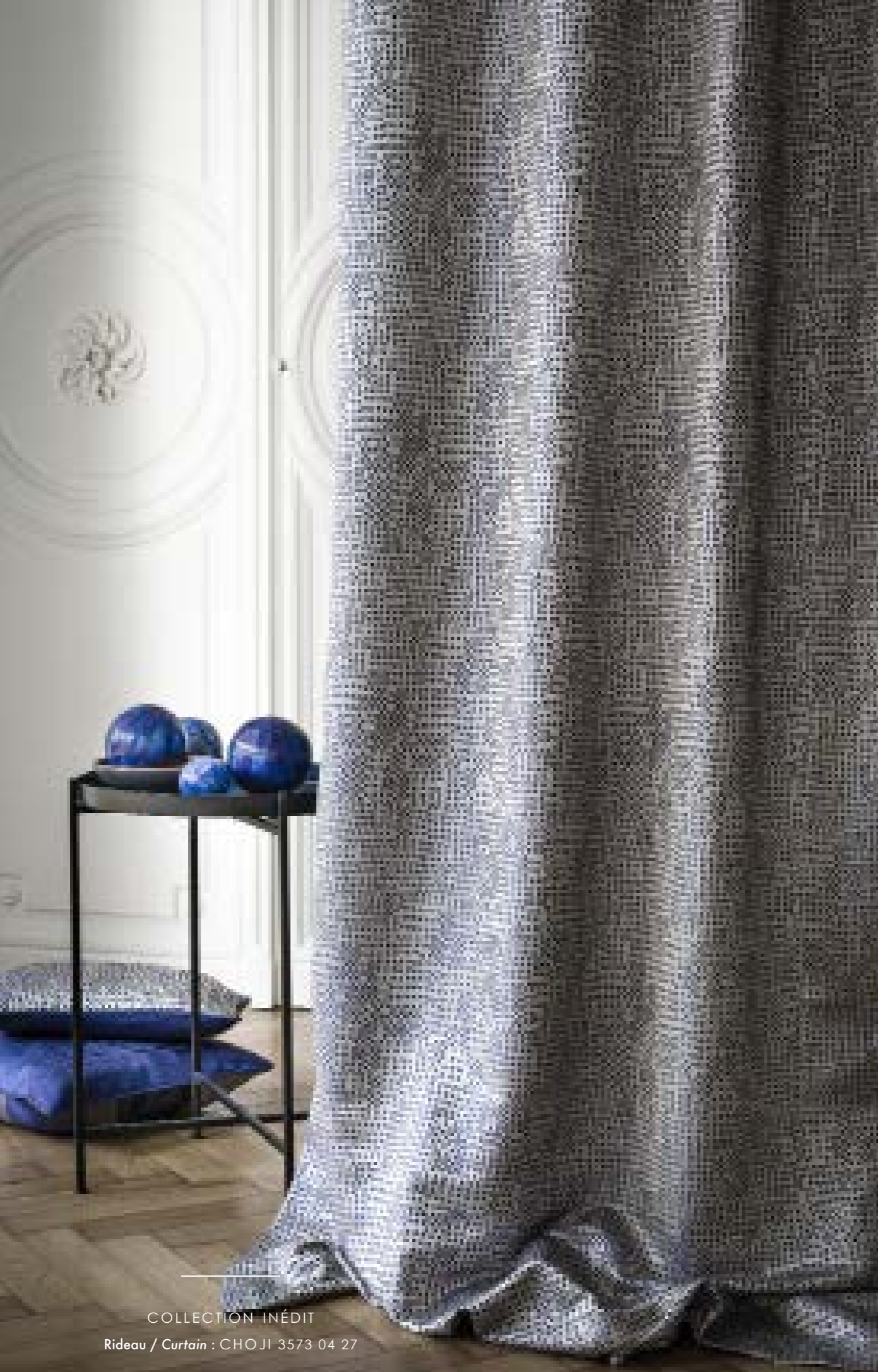
COLLECTION INÉDIT Rideau / Curtain : CHOJI 3573 04 27