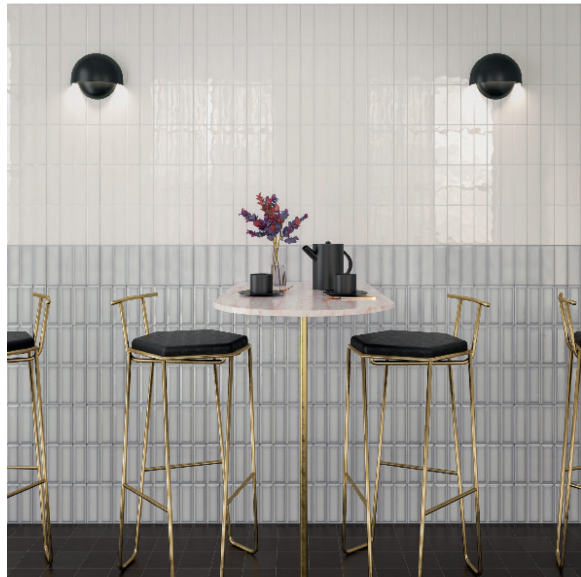
Wall Tiles Silk, Silver & Silver Bevel