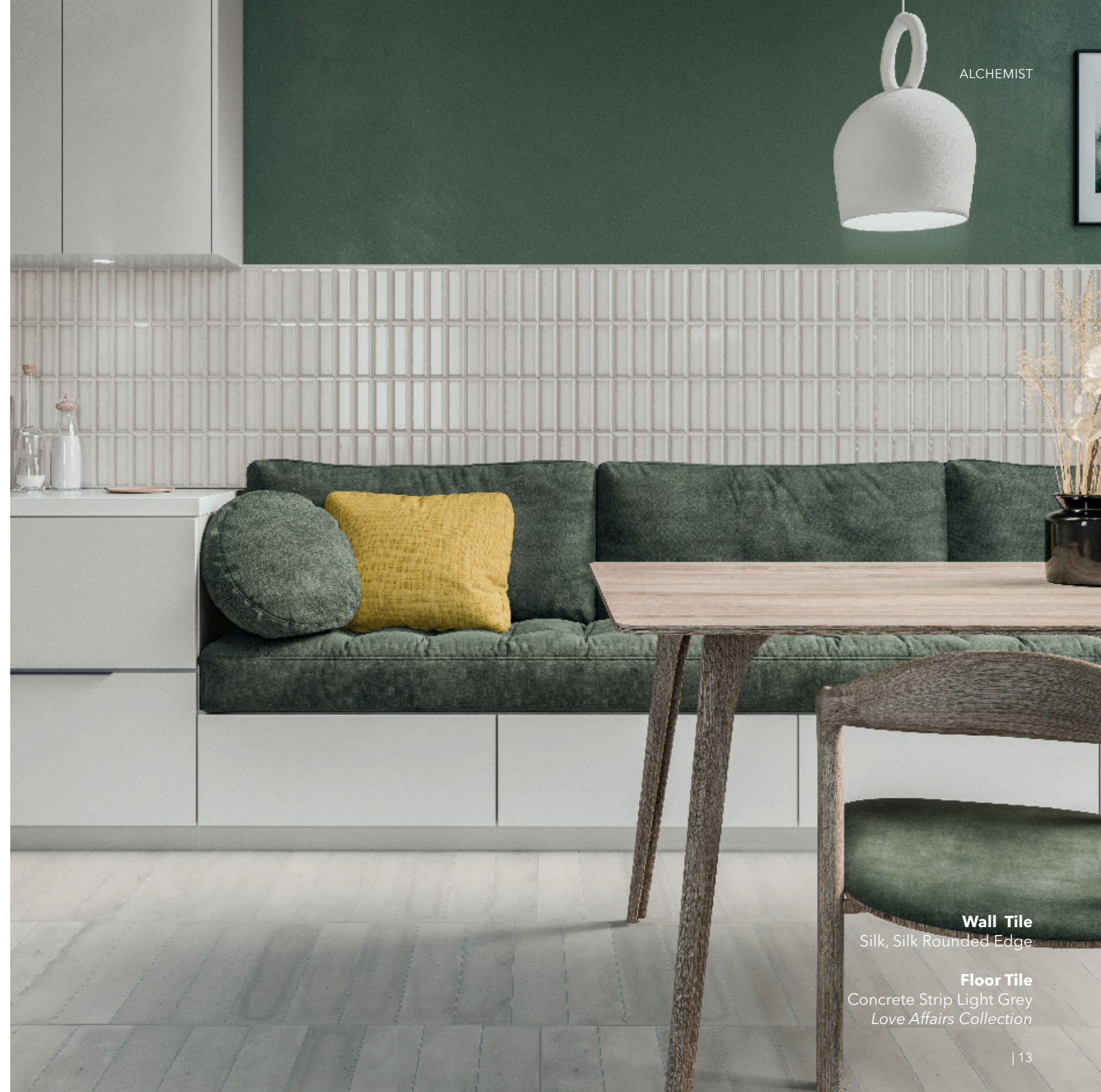
Wall Tile Silk, Silk Rounded Edge