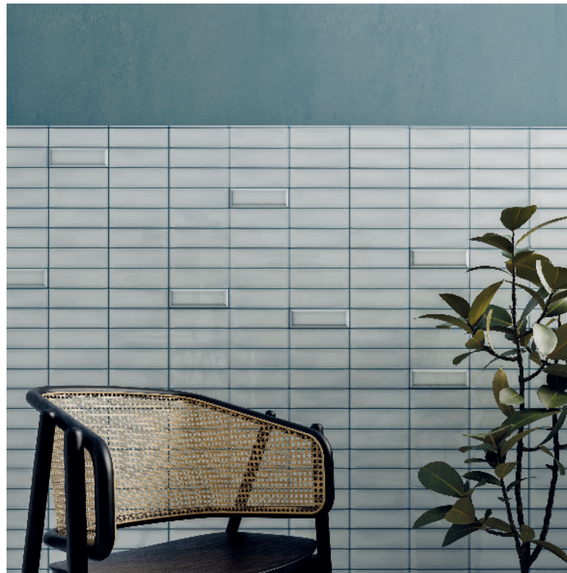
Pool, Pool Bevel & Pool Rounded Edge