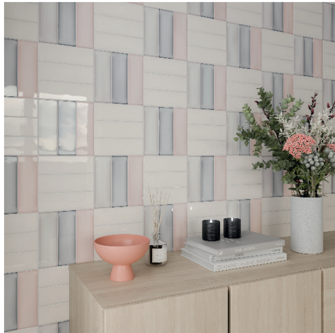
Silk, Linen, Silver & Primrose