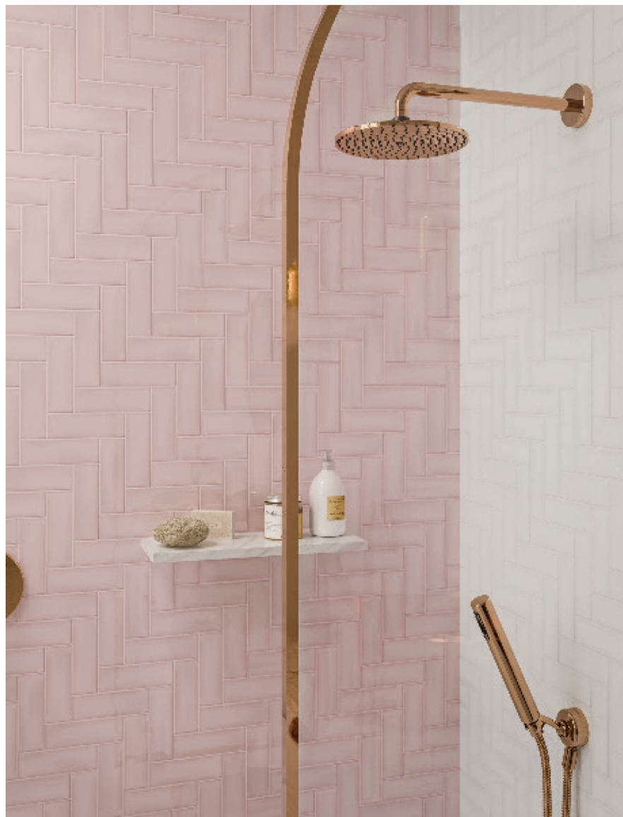
Primrose & Silk