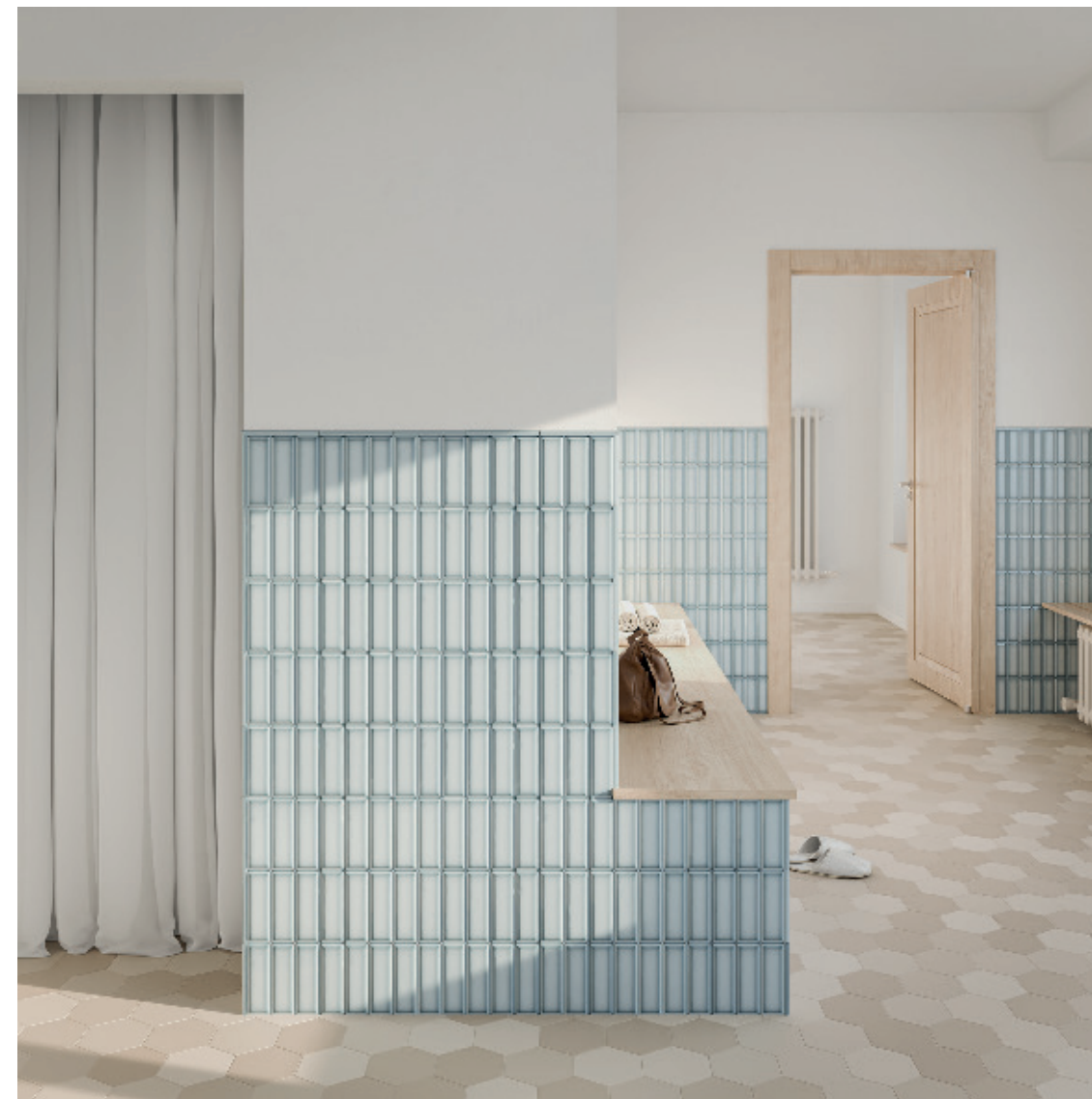
Floor Tiles Six Hexa Greige Six Collection