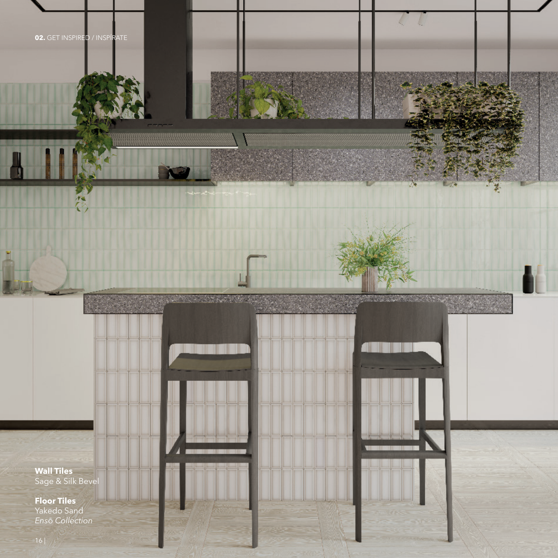
Wall Tiles Sage & Silk Bevel