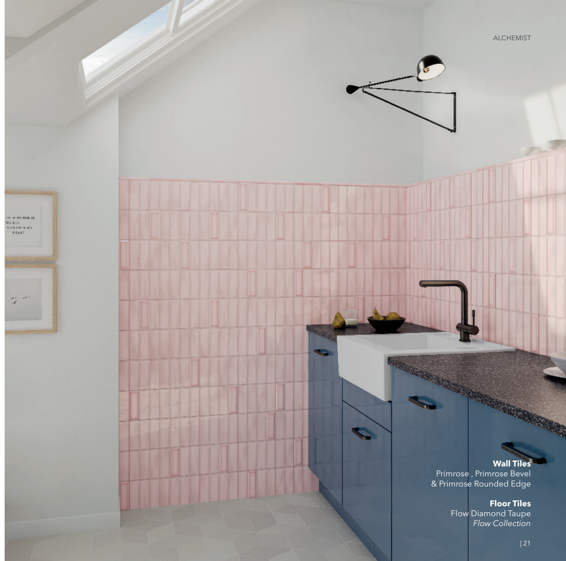
Wall Tiles Primrose , Primrose Bevel & Primrose Rounded Edge