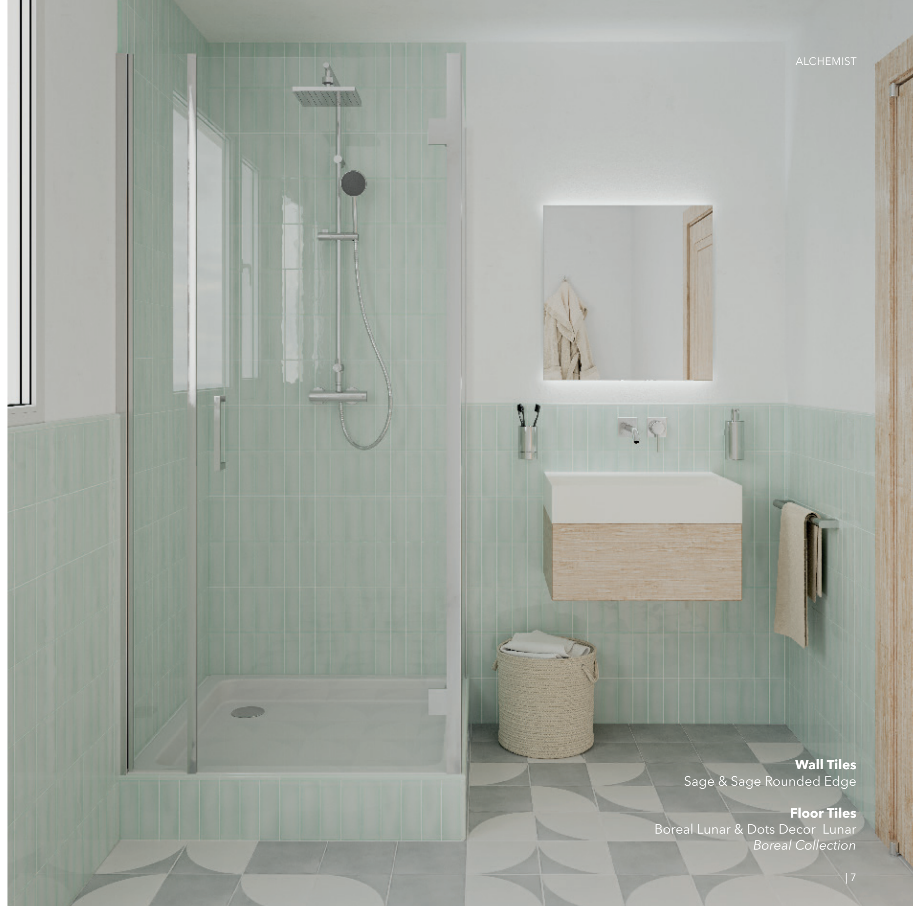
Wall Tiles Sage & Sage Rounded Edge