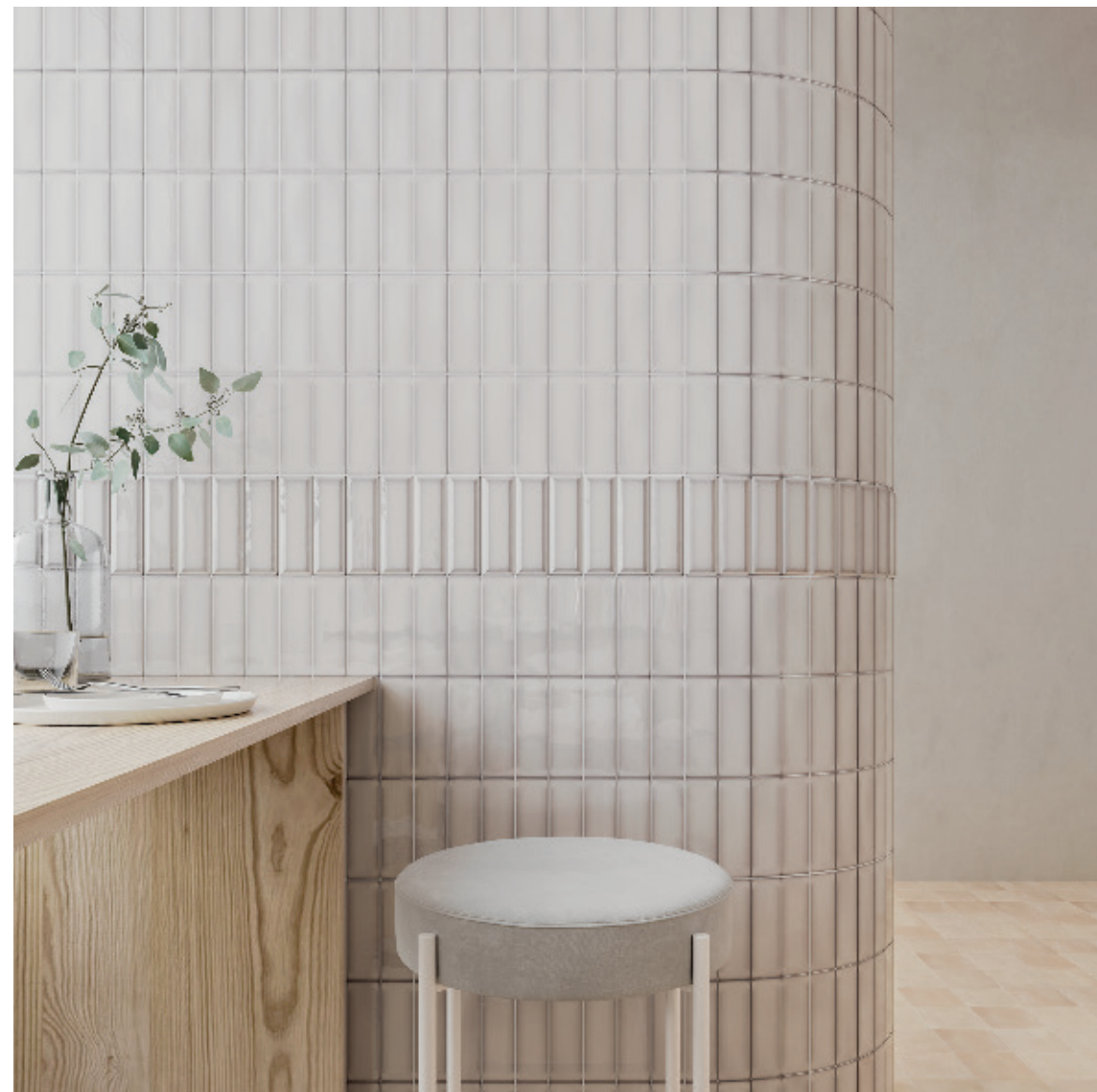
Linen & Linen Bevel