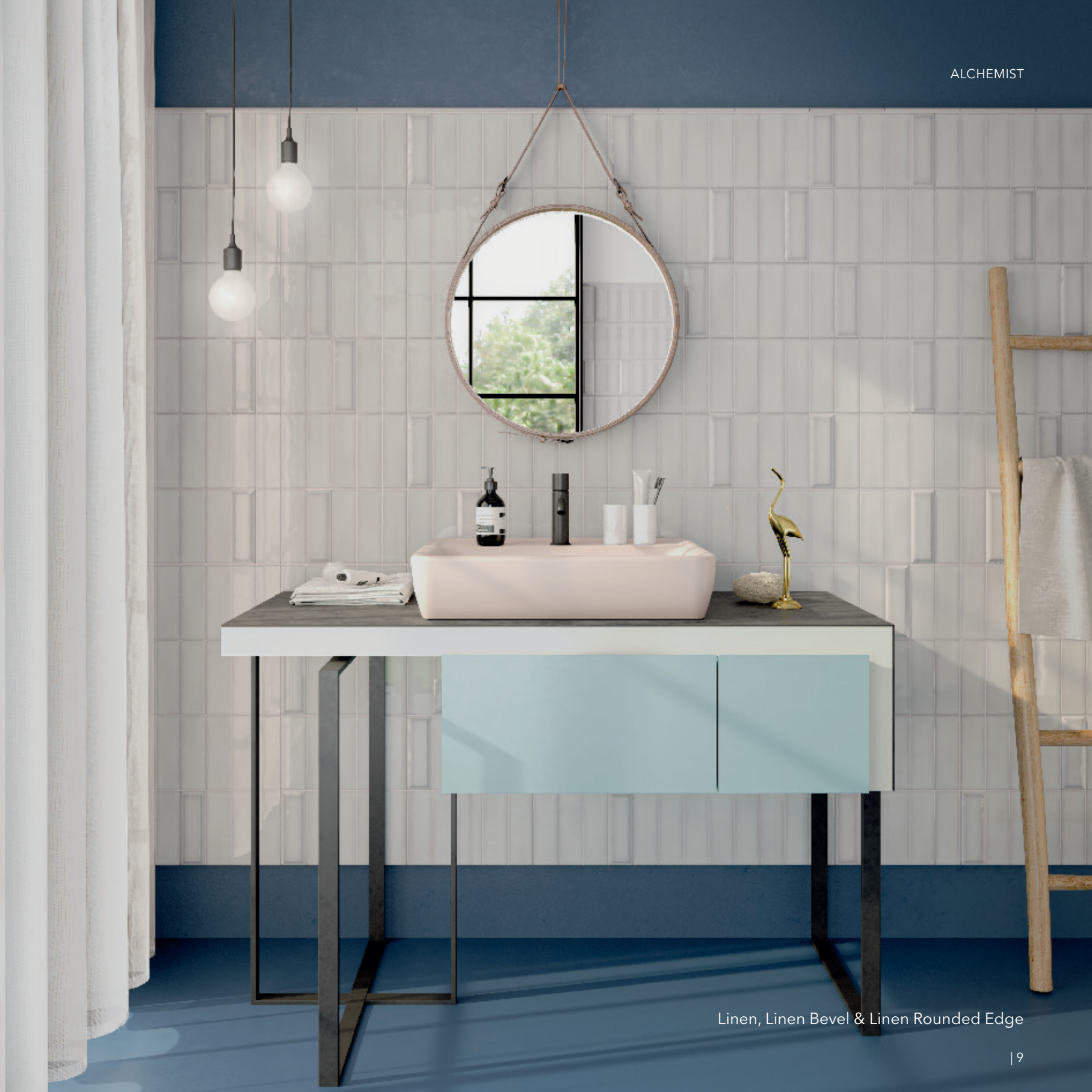
Linen, Linen Bevel & Linen Rounded Edge