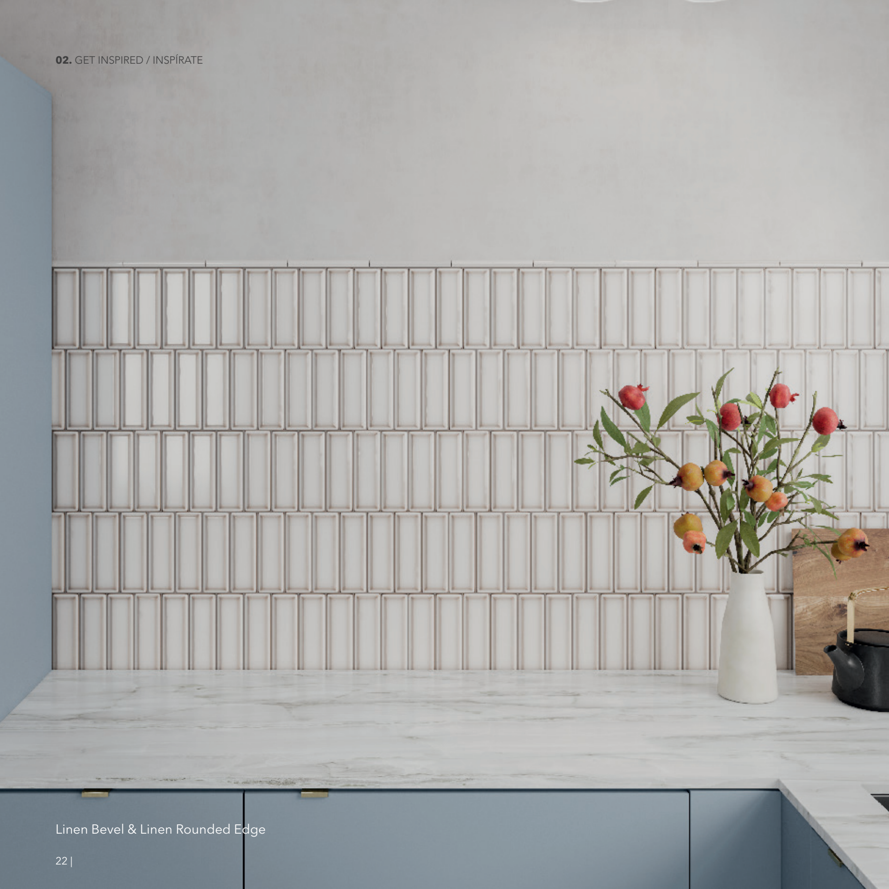
Linen Bevel & Linen Rounded Edge